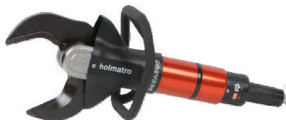
CU 5050 i